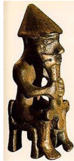
Donar met zijn hamer (donderdag)