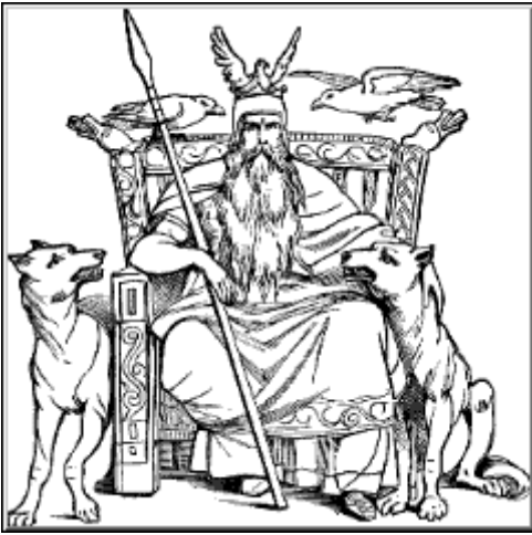
Odin (Wodan) Woensdag